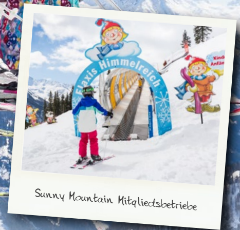
Sunny Mountain Mitgliedsbetriebe